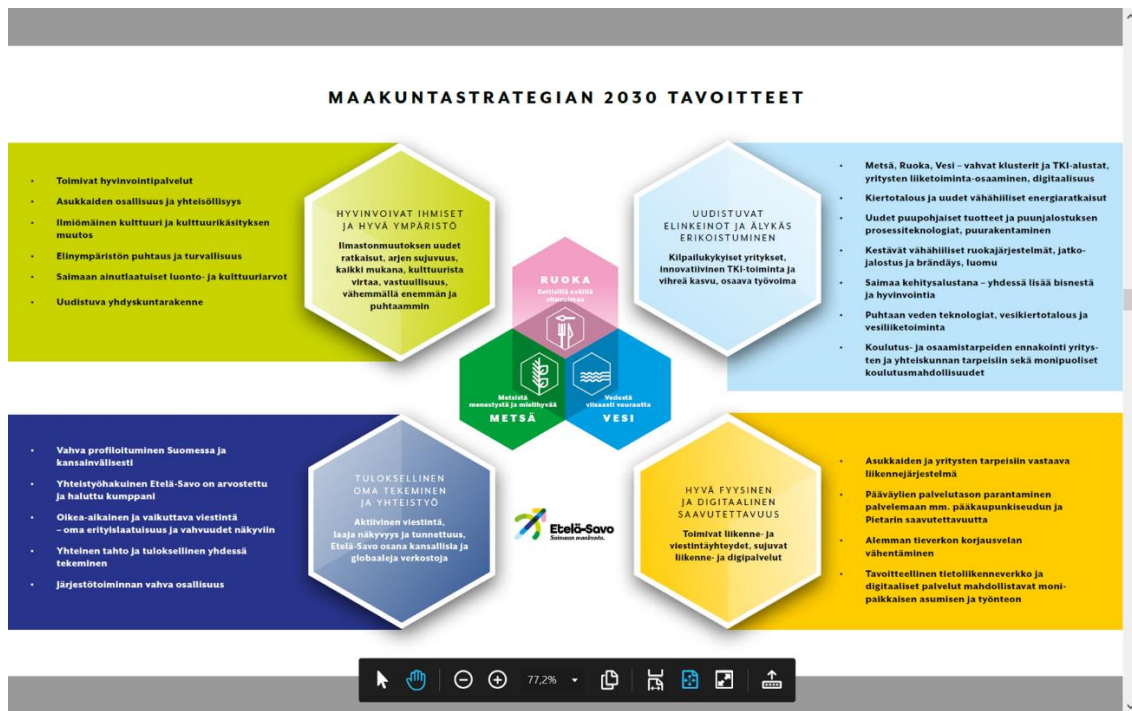
Kuva. Etelä-Savon maakunnan strategiset tavoitteet 2030 ja tavoitteita tukevat painopisteet.

Toimeenpanosuunnitelmassa täsmennettyjen toimenpidekokonaisuuksien/toimenpiteiden mahdollisina rahoituslähteinä voivat olla nykyisen ohjelmakauden 2014-2020 rahoitusmahdollisuudet EAKR- ja ESR-toimintalinjoittain, TEMin Etelä-Savon alueelle myöntämän kansallisen rahoituksen käyttäminen koronaselvitymissuunnitelman mukaisiin toimenpiteisiin ja REACT-EU lisärahoituksen hyödyntämismahdollisuudet alueella sekä soveltuvin osin maaseutuohjelman rahoitus. Seuraavassa kuvassa esitellään Etelä-Savon maakunnan strategian tavoitteet 2030 ja tavoitteita tukevat painopisteet.