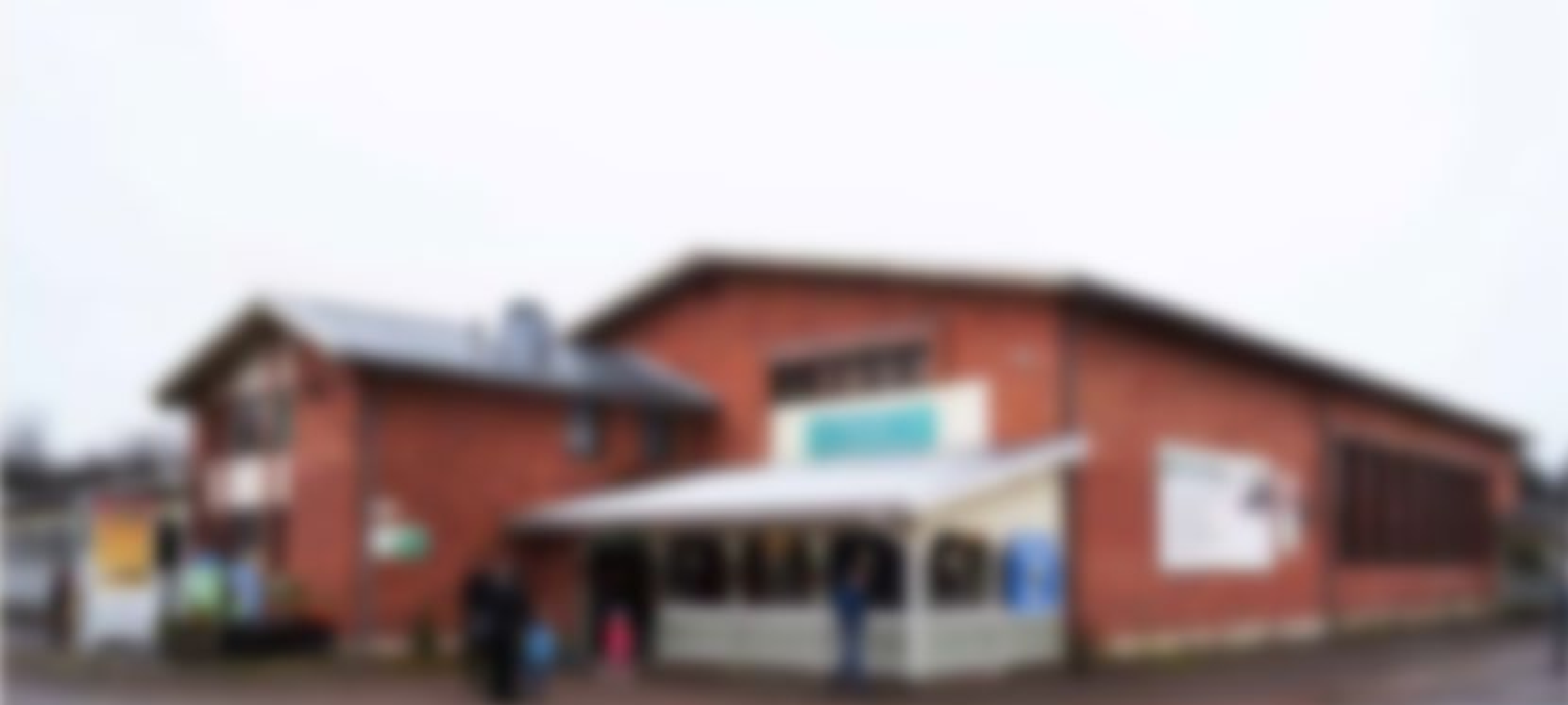
Matkailualue Wanhät Wehkeet Karstula