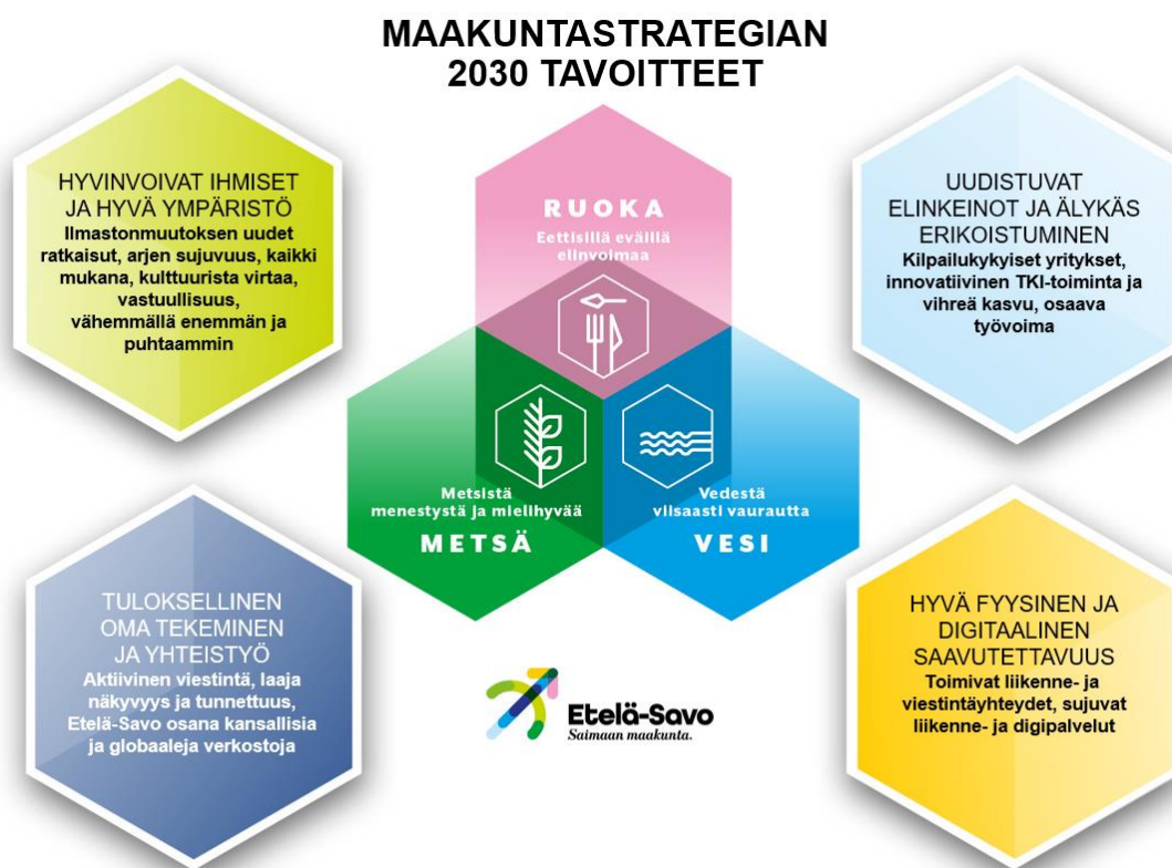
Kuva 1 Maakuntastrategian tavoitteet 2030.

Metsä, Ruoka, Vesi – näihin perustuviin luonnonvaroihin, erityisosaamiseen ja kestävään elinkeinotoimintaan Etelä-Savon kasvu ja elinvoima rakentuu tulevinakin vuosina. Näissä maakunnalla on suhteellinen kilpailuetu Suomessa ja Euroopassa. Osaavat ihmiset, uudistuvat yritykset, kehittyvä toimintaympäristö, digitaalisuus ja hyvä saavutettavuus ovat keskeisimpiä kasvun ja elinvoiman tekijöitä.